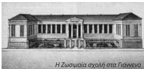
Η Ζωσιμαία σχολή στα Γιάννενα

Γράφει ο συνεργάτης του «Γ» Γιώργος Ι. Ζάχος