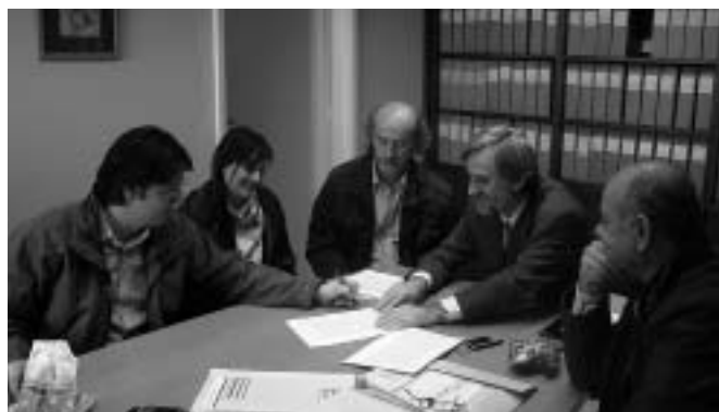
Ο πρόεδρος της τ. ΔΚΝ ενώ υπογράφει το σχετικό συμβόλαιο

«...είναι η φυσική συνέχεια της πρώην Κοινότητας Νεραΐδας, κάτι που εκπληρώνει κατά το μέγιστο τη βούληση της κληροδότριας.