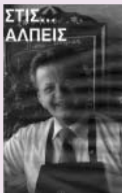
Από το "σανίδι" της Νεράιδας στα πλατώ των "Αλπεων"