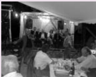
Εγέρασα μωρέ παιδιά...