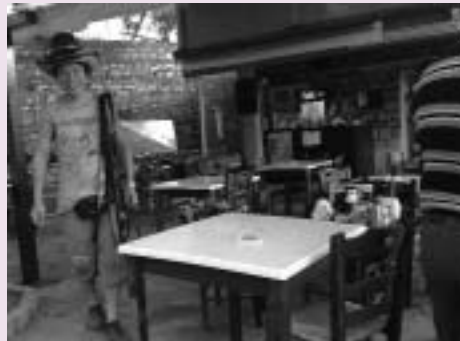
παγκοσμιοποίηση ή ενδιαφέρον της cosko για επενδύσεις στη Νεράιδα;