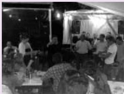
χορεύοντας τον «Ήλιο» αντ' αυτού

☼ ...φες περάσαμε πολύ καλά, απόψε όμως σκεπτόμαστε να περάσουμε ...ακόμα καλύτερα!!!