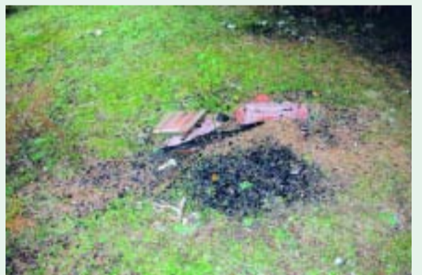
Ασυνείδητοι άναψαν φωτιά στον αύλιο χώρο του εξωκλήσιου της Παναγίας στο Παχτούρι. Μία και μόνο σπίθα της, αρκούσε για την καταστροφή.