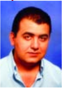
Γράφει ο Δημήτρης Ηλ. Τσακάλος, Αρχισυντάκτης

Ασυνήθιστα χαρακτηρίζονται από πολλούς όλα όσα συμβαίνουν τους τελευταίους μήνες στην ορεινή μας πατρίδα. Και είναι ασυνήθιστα όλα αυτά γιατί είναι σπάνιο γεγονός για την εποχή μας, νέο άνθρωποι να προτάσσουν τα στήθη τους και να ασχολούνται με την τύχη του τόπου τους. Να δείχνουν εμπράκτα το ενδιαφέρον τους για το σήμερα και το αύριο μιας πολύπαθης ορεινής περιοχής, μέσα από ένα ιστορικό συνέδριο προβληματισμού και συμπερασμάτων όπως αυτό που οργανώνεται στην Αθήνα. Και είναι ιδιαίτερη η αξία όλων αυτών γιατί αυτοί οι νέοι άνθρωποι που έλκουν την καταγωγή τους από τα έξι χωριά της διευρυμένης κοινότητάς μας δεν διψούν για εξουσία, δεν ενδιαφέρονται για την δημοσιότητα, δεν έχουν ιδιοτελείς σκοπούς ενώ βρίσκονται μακριά από τη μικροπολιτική και τη μικροσυμφέροντα που δυστυχώς δρουν και στον δικό μας τόπο.