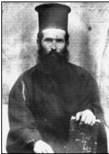
Ο Κωνσταντίνος Κόγκκος κατά το 1910