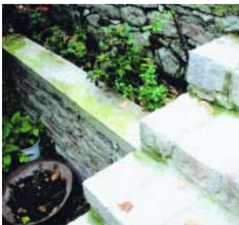
Πέτρινα σκαλοπάτια και τοίχος φτιαγμένα με μεράκι από γυναικεία χέρια.