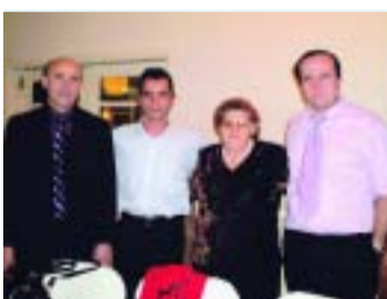
Φωτογραφίες από τον περσινό χορό της Κορυφής