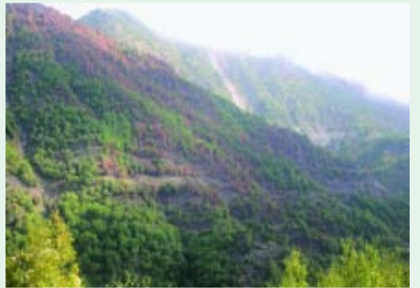
Με σύμμαχο τη βροχή έσβησε η καταστρεπτική φωτιά στο Καψάλι.

Στη Νεράιδα είχαμε πυρκαγιά στην περιοχή του Αη-Θόδωρου όπου κατασβήστηκε με πυροσβεστικό αεροπλάνο. Στην περιοχή Διαλεγμένο (διασταύρωση προς Μυρόφυλλο του δρόμου Βαθύρευμα-Μεσοχώρα) είχαμε μεγάλη φωτιά η οποία κατασβήστηκε από αεροπλάνο και ελικόπτερο ενώ στην περιοχή Καψάλι (απέναντι από το Διαλεγμένο) αφού η φωτιά κατάστρεψε ένα μέρος του δύσβατου δάσους αν και το ελικόπτερο έκανε ρίψεις νερού τελικά έσβησε από τη βροχή.