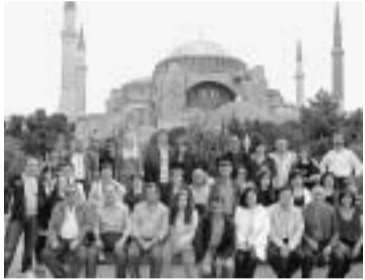
Οι Κορυφιώτες και οι φίλοι τους σε αναμνηστική φωτογραφία στη Αγία Σοφία.

Επόμενη στάση στα εσωτερικά της Τουρκίας. Και θερμασιμός της διαδρομής το απόγευμα σε ξενοδοχείο στο κέντρο της Κων-