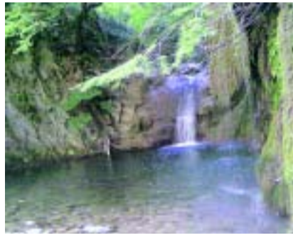
Το Γαλάζιο στο Βακαριώτη (αυτός ο βροξ(=βιρός) ήταν ό,τι για τους Μεσοχωριτες τα Καζάνια, για τους Αειπτώτες η Πλάκα. Φαίνεται να το έλεγαν Γαλάζιο λόγω του σχετικού βόθρου).

Τα τελευταία χρόνια ο οικισμός Ξαναζωντανεύει, κυρίως το καλοκαίρι. Πολλά νέα σπίτια φτιάχνονται και οι εποχιακοί κάτοικοι αυξάνονται. 20 σπίτια λειτουργικά αποτελούν το σημερινό οικισμό. Ο δρόμος συνεχώς βελτιώνεται και αξίζει τον κόπο να ανέβει κανείς μέχρι εκεί. Δροσε-