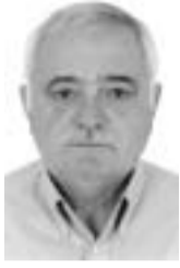
Γράφει ο Ιωάννης Φ. Τεντολούρης

Οι κάτοικοι του χωριού μου, στις δεκαετίες του εξήντα και εβδομήντα του περασμένου (20ου) αιώνα, ένιωθαν έντονη την ανάγκη για κουβέντα. Δεν υπήρχαν βλέπετε ούτε ραδιόφωνα ούτε τηλεοράσεις να ακούσουν ειδήσεις και να μάθουν «νέα». Μόλις συναντούσαν άνθρωπο ή βρίσκονταν σε παρέα εύρισκαν ευκαιρία να