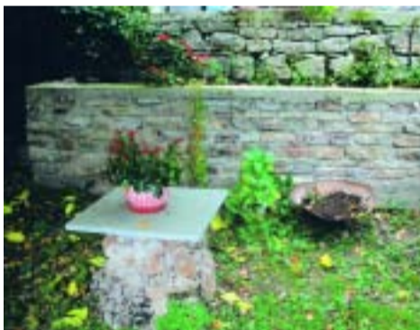
Να που δεν είναι απαραίτητα τα σιβαρά χέρια για να δημιουργήσεις με την πέτρα. Το μυστικό της επιτυχίας θα σας το αποκαλύψει η πρώην πάρεδρος.