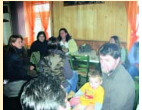
27 Οκτωβρίου και η «Αίγλη» της Νεραΐδας είναι κατάμεστη από κόσμο. Όσο για τα μεζεδάκια, όλοι έδειχναν να τα απολαμβάνουν.