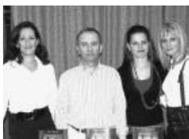
Στο χώρο της υποδοχής του κοινού.