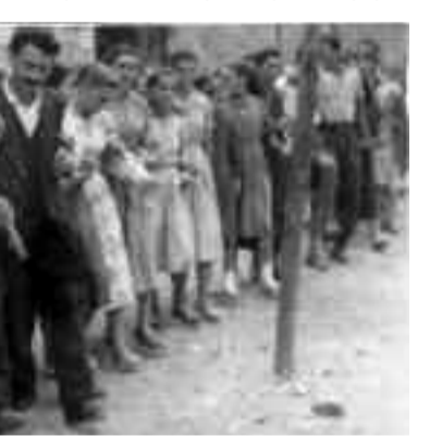
Το Διπλοκάγκελο είναι η αποκορύφωση του πανηγυριού. Η ψυχική ένωση των ορεινών.

τερο πατητήρι σταφυλιών, όπου θα χορεύουν κάθε λογής «λαοφιλή άσματα». Οι Σύλλογοι θα αποκτήσουν εμπορικό χαρακτήρα και έτσι θα βλέπουμε ορχήστρες με σκυλοδημοτικό ή σκυλολαϊκό ρεπερτόριο, ρίχνοντας την ποιότητα χαμηλά, αρκεί να υπάρχουν εύρωστα ταμεία. Το πλαστικό ποτήρι και πιάτο, το άψηγτο σουβλάκι καθώς και τα βαρέλια με πάγο για τα ποτά, έρχονται σε δεύτερη μοίρα. Αυτά τα συναντούμε σήμερα σε χωριά που δεν έχουν παράδοση, δεν έχουν λαϊκό πολιτισμό. Όπως επίσης, θα υπάρχουν και Σύλλογοι που κατά περιόδους θα είναι αδρανείς, οι λεγόμε-