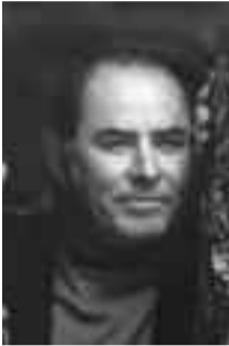
Γράφει ο Κώστας Καρασούλας

ζαν ερωτηματικά κι ορισμένοι με δυσπιστία. Μ' αυτός μια ζωή κει πάνω την είχε αφήσει: στο κατάκορφο του πιο αψηλού βουνού, που βλεφαροκοπούσανε τις αφέγγαρες νύχτες