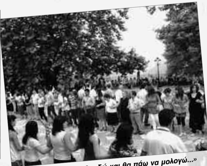
«είμαι ξένος και θα ιδώ και θα πάω να μολογώ...»