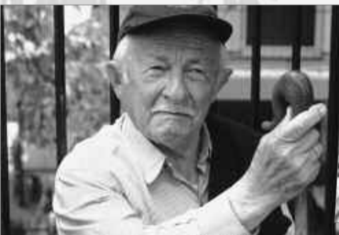
Οι παλιότεροι καμαρώνοντας τους νέους νοσταλγούν τις παλιές εποχές.

Η τηλεόραση δυτικής Ελλάδας, ART tv ήταν εκεί και κατέγραψε για την εκπομπή «στα μονοπάτια της παράδοσης» το πανηγύρι της Νεραϊδας, παραδοσιακό αυθεντικό, όπως γίνεται κάθε χρόνο, όπως το θέλουν οι κάτοικοι του χωριού. Γιατί, έτσι τους αρέσει.