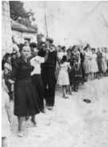
Το πανηγύρι τότε ήταν τρόπος ζωής. Όλο το χωριό συμμετείχε στο κορυφαίο αυτό γεγονός.

Έτσι, λοιπόν, με την εισβολή των Συλλόγων στη διοργάνωση των πανηγυριών θα έχουμε ριζικές αλλαγές που μόνο πανηγύρια δε θα θυμίζουν. Θα καταργηθεί η «παραγγελία». Ένας ιερός θεσμός,