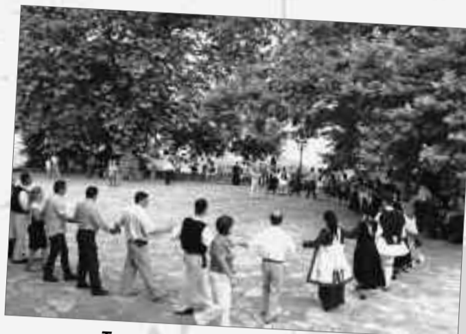
Το πανηγύρι ξεκινάει χορεύοντας Τζουμερκιώτικους ρυθμούς