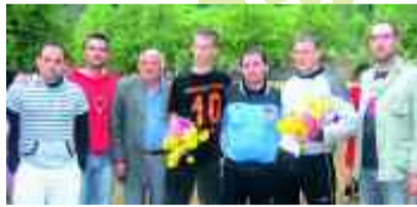
Μέλη του Πανθεσσαλικού Συλλόγου μαζί με τους αρχηγούς των δύο ομάδων και τον διαιτητή μετά την απονομή.