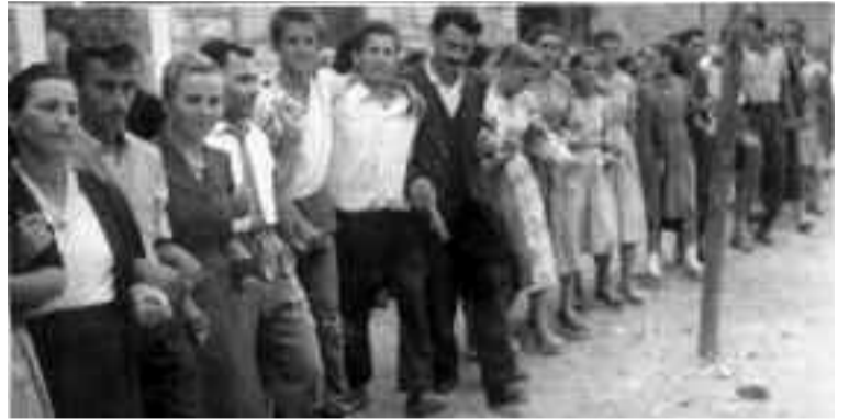
Το Διπλοκάγκελο είναι η αποκορύφωση του πανηγυριού. Η ψυχική ένωση των ορεινών.

Κάποιοι όμως ισχυρίζονται πως ήρθε η στιγμή να αναλάβουν τη διοργάνωση των πανηγυριών οι πολιτιστικοί Σύλλογοι. Η άποψή μου είναι πως, όχι. Ναι στις πολιτιστικές εκδηλώσεις στα χωριά μας από τους Συλλόγους, καθώς και στη συμμετοχή τους στο πανηγύρι