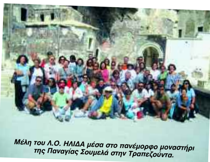
Μέλη του Λ.Ο. ΗΛΙΔΑ μέσα στο πανέμορφο μοναστήρι της Παναγίας Σουμελά στην Τραπεζούντα.