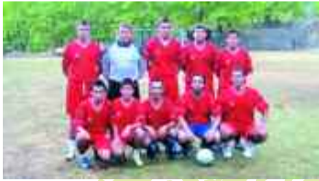
Η κυπελούχος ομάδα του Αρματολικού.