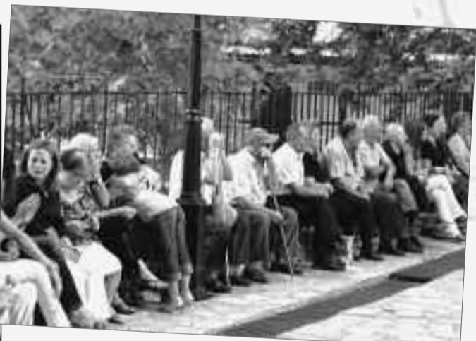
Από το πεζούλι της πλατείας παρακολουθούν το χορό.