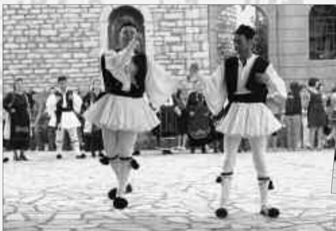
Στην έκσταση του λεβέντικου και λυρικού τσάμικου.