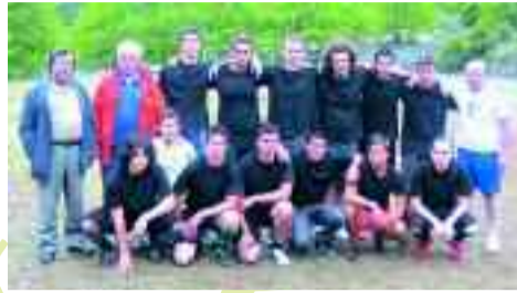
Η ομάδα του Μυρόφυλλου.