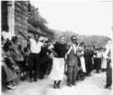
Οι νέοι στα πανηγύρια κυρίως έβλεπαν τις κοπέλες της αρεσκείας τους.

Διαπιστώνεται, ωστόσο, κατά τρόπο αναμφισβήτητο πως τα τελευταία χρόνια τα πανηγύρια μας