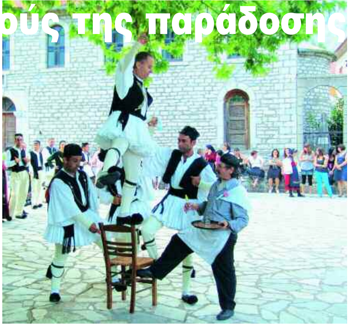
Με δεξιοτεχνία πάνω στην πλάτη της ξύλινης καρέκλας. Ο χορός της Παπαδιάς των Τζουμέρκων της Ηπειρώτικης ψυχής στο αποκορύφωμα.

Η στροφή προς την παράδοση και τις ρίζες μας είναι μονόδρομος για την ορεινή μας πατρίδα. Είναι χρέος όλων μας να επαγρυπνούμε και να προσφέρουμε ό,τι ο καθένας μας μπορεί από το δικό του μετερίζι. Ακόμη και η παρουσία σε μία εκδήλωση των χωριών μας είναι προσφορά στον τόπο μας.