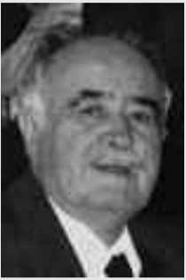
Γράφει ο Λαφινιώτης Ευάγγελος Γ. Βλάχος

Τα τελευταία χρόνια είχα ένα όνειρο, ν' ανέβω μια μέρα στον Κάναλο, εκεί που περπάτησα τα περισσότερά μου χρόνια, εκεί που είχαμε τα χωράφια και βοσκοίσαμε τα γίδια. Τα κατάφερα φέτος το καλοκαίρι.