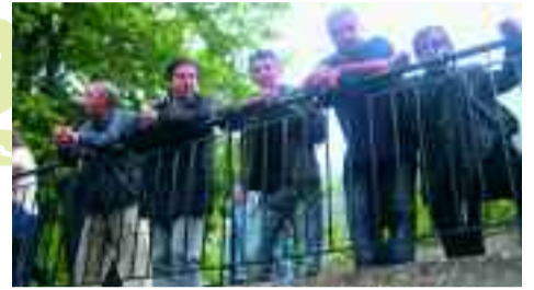
Παρούσα και η Κοινότητα στον τελικό.

Δυναμική ήταν στο Παχτούρι η φετινή παρουσία του Πανθεσσαλικού συλλόγου Παχτουριωτών Βόλου και της νεολαίας του χωριού ανατρέποντας τα μέχρι σήμερα δεδομένα και δίνοντας το στίγμα ότι το μέλλον ανήκει στη νέα γενιά του χωριού.