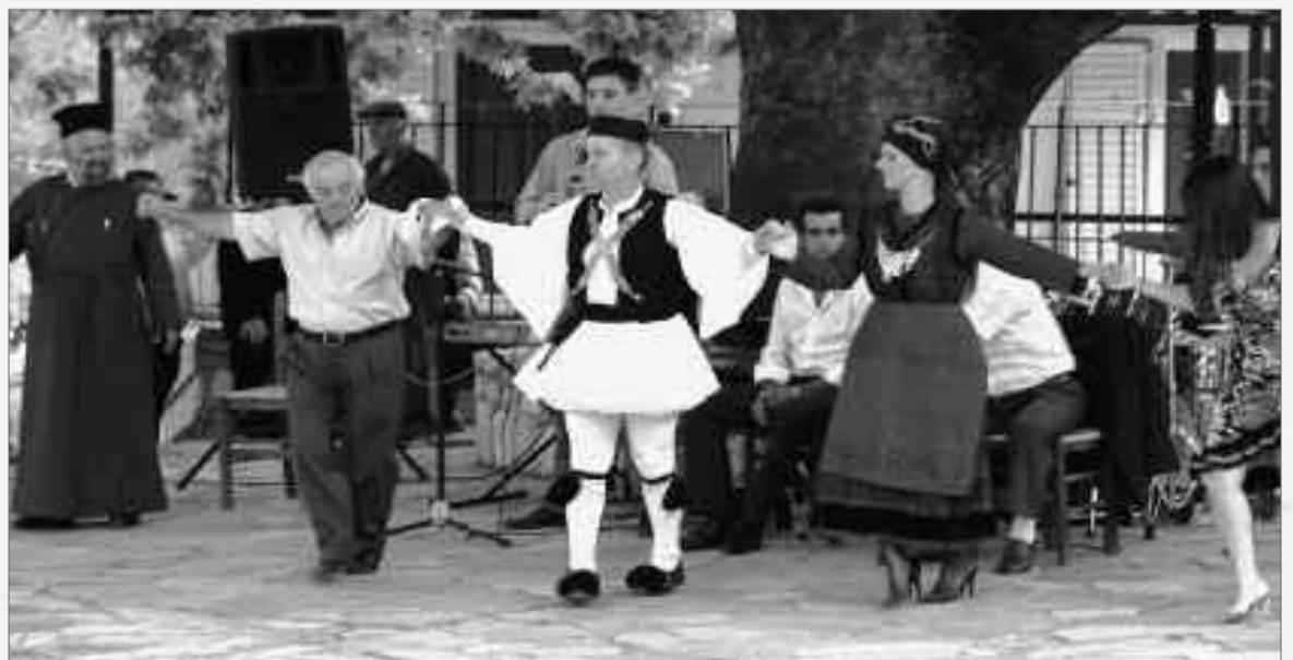
Τζουμερκιώτικοι ρυθμοί στο πανηγύρι της Νεραϊδας.

Αναδημοσίευση από την «Ελευθεροτυπία», Δευτέρα 27 Ιουλίου 2009