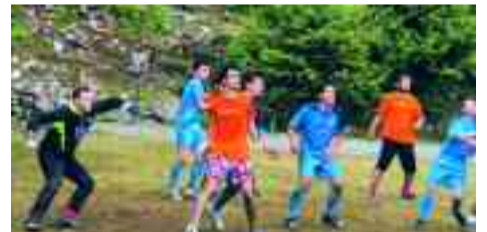
Στιγμιότυπο από τον αγώνα Παχτουρίου-Λαφίνας (γήπεδο Παχτουρίου).