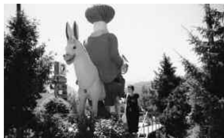
Μια ζωή πήγαινα ίσια. Τί κατάλαβα; (Χότζας).

Φτάνουμε στη Μαλακοπή (= δυσκολία να κερδίσουν το ψωμί τους α-