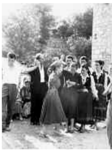
Πανηγύρι στην ορεινή πατρίδα τέλος της δεκαετίας του '50. Τότε που στην πλατεία του χωριού ο χορός ήταν διπλός. Σήμερα ο διπλός σπανίζει, με τάση κατάργησης και του μονού.

Επίσης ένας άλλος λόγος που τα πανηγύρια μαραζώνουν είναι ότι, μετά τη μεγάλη εσωτερική μετανάστευση στα μεγάλα αστικά κέντρα, η ζωή των ανθρώπων άλλαξε ριζικά, ανεβάζοντας αισθητά και το βιοτικό τους επίπεδο. Η διασκέδασή τους, ποιοτική ή όχι, είναι ένα καθημερινό φαινόμενο, με αποτέλεσμα το πανηγύρι του χωριού να μην τους συγκινεί, να μην το νοσταλγούν, και γι' αυτό να μη συγκαταλέγεται στις διασκέδασεις τους. Έτσι, λοιπόν, το κορυφαίο αυτό γεγονός του λαϊκού μας πολιτισμού περνάει απαρατήρητο, μπαίνοντας σιγά - σιγά στο περιθώριο και στη λήθη της ιστορίας