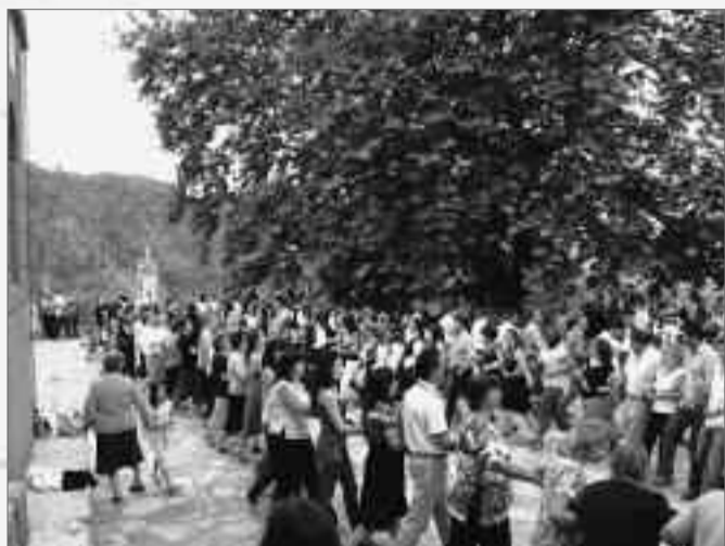
«μα τον Άγιο Κωνσταντίνο το χορό δεν τον αφήνω...»