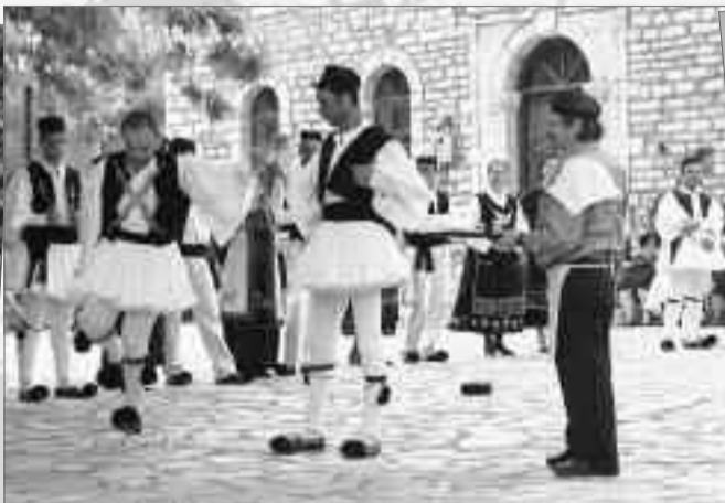
Χορεύοντας τελετουργικά πάνω στα ποτήρια. Στο ρυθμό της μεθυστικής μελωδίας και το βασιανιστικό μεράκι του χορού της Παπαδιάς.