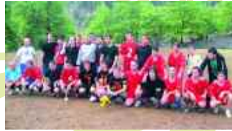
Νικητές και ηττημένοι, μετά τον τελικό.