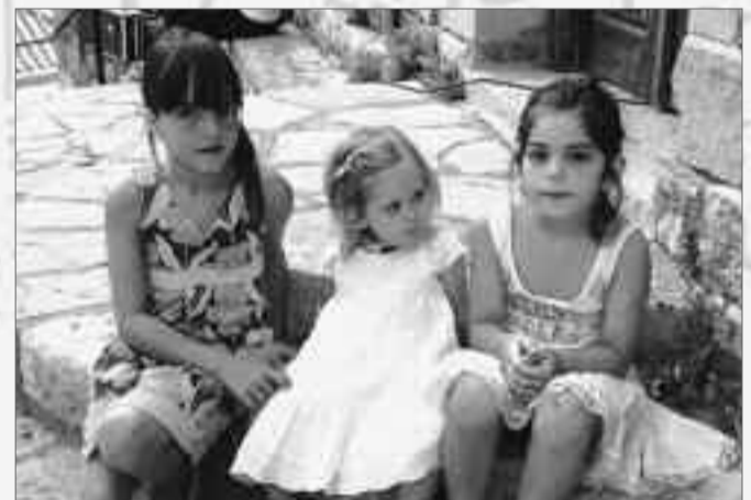
Τα μικρά παιδιά συμμετέχοντας και αυτά στο πανηγύρι αποκτούν βιώματα παράδοσης και πολιτισμού.