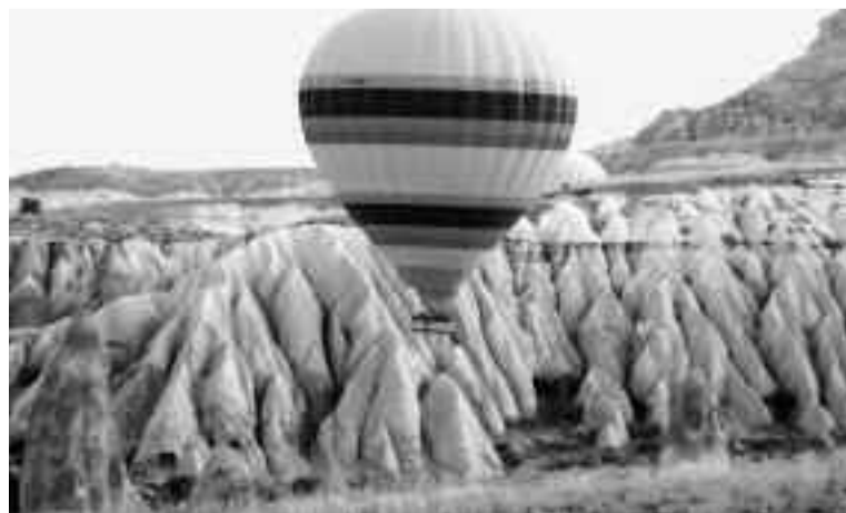
Τρέμε, Αετέ, έρχεται η Ελένη "πετώντας".

δ' εχθρός και επίβουλος (= μηχανορράφος) πόρρω της Πύλης ταύτης». Μακάρι να μαντεύαμε τις προθέσεις όσων προσεγγίζουν την πόρτα του σπιτιού μας ή οι ίδιοι να σέβονταν την επιγραφή. Καραμπαλέ (= τύπος με αμπέλια) τα οποία έκοψαν, τα έκαναν καυσόξυλα και την περιοχή μεπτόν-αρμέ όπως εμείς την Αττική όλη... Νεάπολη, Θειάτειρα, Φλαδέλφεια, Λαοδίκεια, Σάρδεις. Η Αγία Φωτεινή έγινε Hilton. Μίλητος, όπου εκβάλλει ο ποταμός Μαϊάνδρος (Θαλής, Ανακρέων, Αναξίμανδρος, Αναξίμενης, Γρηγόριος ο Θαυματουργός, ο Νεοκαισαρείας, Βασίλειος ο Μέγας, Γρηγόριος Ναζιανζηνός, Γρηγόριος ο Νύσσης, αδελφός του Βασιλείου. Και παλαιότερα Μ. Κωνσταντίνος, Ιουστινιανός, Ηράκλειος, που νίκησε τον Χοσρόη τον Β' το 623 μ.Χ.