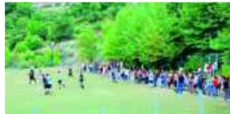
Πλήθος κόσμου παρακολούθησε τους αγώνες (γήπεδο Νερίδας).