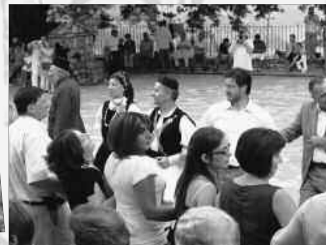
«συ που σέρνεις το χορό κάνε κι άλλο κάγκελο...»

Στα μονοπάτια της παράδοσης, στο διάβα των χρόνων πορεύεται η Νεραΐδα των Τζουμέρκων. Χωριό που αντιστέκεται σθεναρά σε τούτους τους χαλεπούς χρόνους. Πηγαίνοντας κόντρα στα σημεία των καιρών, του μαρασμού των παραδόσεων από μια στείρα παγκοσμιοποίηση και την υποκοουλτούρα γενικότερα, που προσπαθούν στο πέρασμά τους να ισοπεδώσουν τα πάντα. Ακολουθώντας πιστά τα βήματα στην παράδοση, κρατώντας με σεβασμό και αυστηρότητα τα ήθη και έθιμα, τις παραδόσεις και τα κορυφαία γεγονότα του πολιτισμού, στην τοπική κοινωνία του χωριού, όπως είναι τα πανηγύρια.